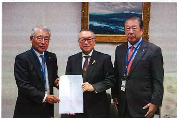
左から野坂筆頭副会長、宮沢税制調査会会長、飯野税制委員長