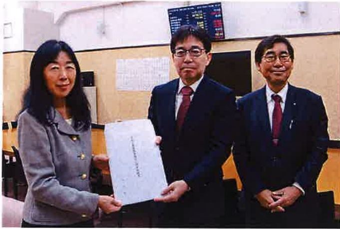
左から丸山税制副委員長、青木主税局長、田中専務理事