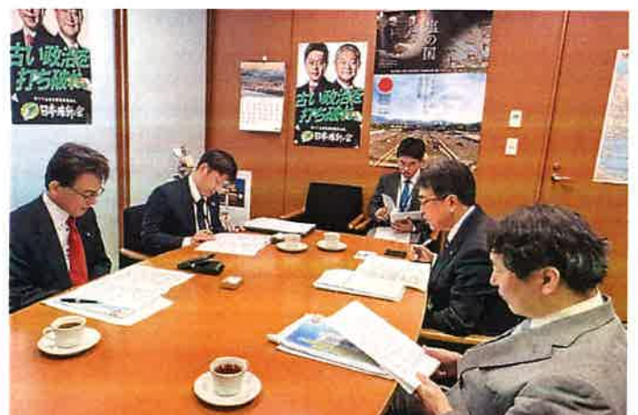
片山政務調査会会長代行（左手前）